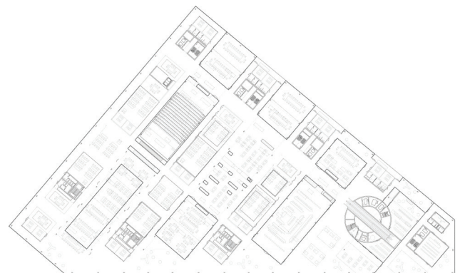
Grundriss 3. Obergeschoss

Durch einen radikalen Schnitt oberhalb des zu erhaltenden, sich im Sockel des Gebäudes befindlichen Einkaufszentrums, wird die ineffiziente Struktur des Bestands entfernt und durch einen funktional, strukturell und energetisch optimierten Baukörper ersetzt. Die rein funktionalen Verwaltungs- und Technikebenen sind im Sinne einer grösstmöglichen Effizienz gestaltet. Dies erlaubt punktuelle Grosszügigkeit, welche im Besonderen in der repräsentativen ‚Bel Etage‘ in Erscheinung tritt. Die kommunikativen Nutzungen werden hier auf einer Ebene zusammen geführt. Die fließenden Räume zwischen den Auditorien und den Sitzungszimmern erleichtern die Orientierung, schaffen spannende Raumfolgen und bieten attraktive Aufenthaltsbereiche für Gäste und Nutzer.